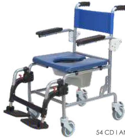
54 CD I AN 46 RR ABS