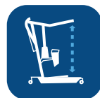
Velocidad de elevación ▼