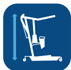
Máx. Altura (con brazo corto/extendido) ▼