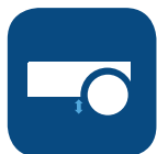
Distancia al suelo ▼