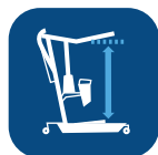
Rango de elevación (con brazo corto/extendido) ▼