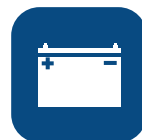
Ciclos (elevaciones por carga)** ▼