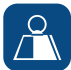
Peso total producto ▼