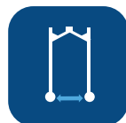
Ancho interno con patas cerradas ▼