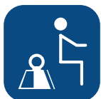
Peso seguro SWL ▼

Todas las medidas se han realizado con ruedas de 100mm, placa de bipedestación inclinada 5° y un usuario de 80kg. Todas las medidas han sido tomadas con una tolerancia de + 3%.