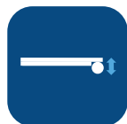
Altura de pata ▼