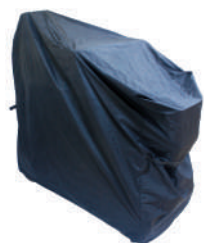
Funda de almacenaje