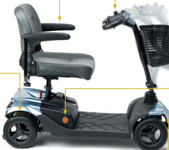
Columna de conducción