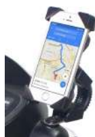
Soporte para móvil