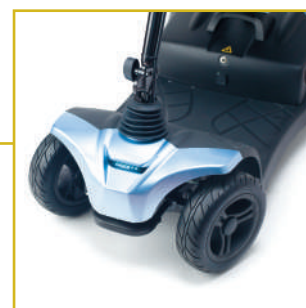
Luz led delantera