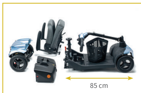
Desmontable en 4 piezas