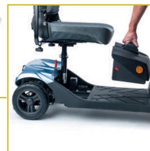
Baterías extraíbles para facilitar su recarga