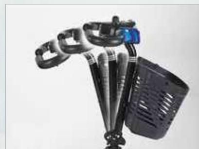
Manillar ajustable para mejorar la posición de conducción