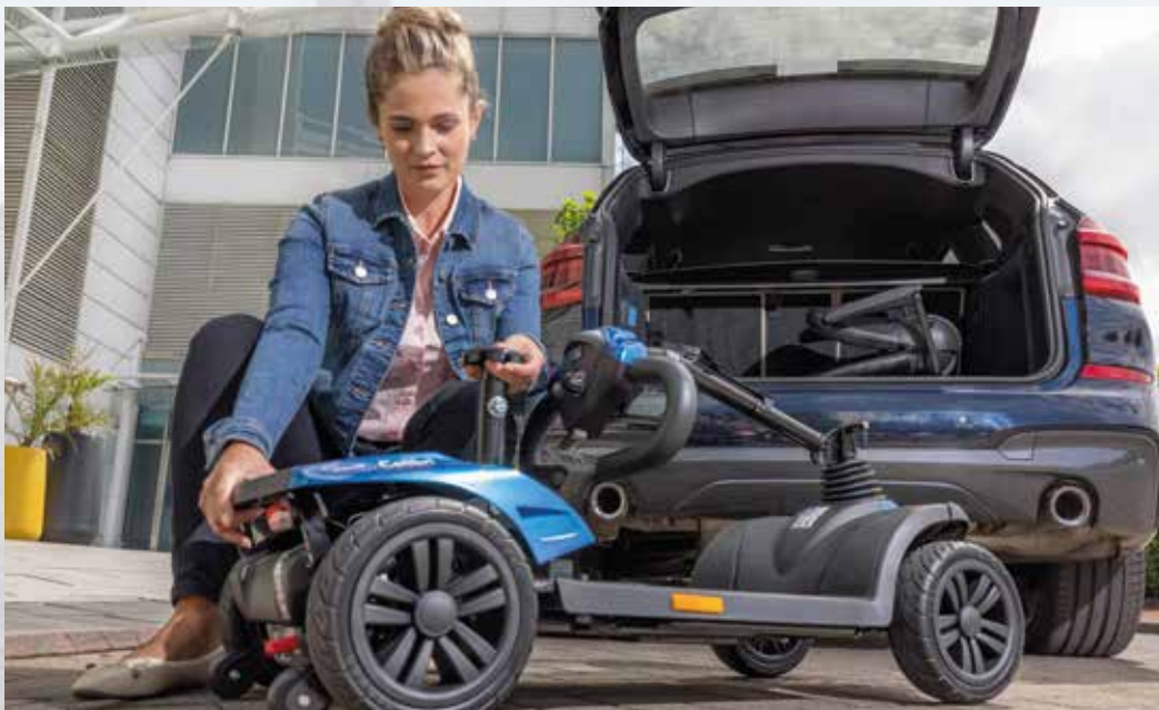
Fácil de transportar gracias al sistema Litelock™