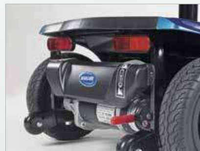
Iluminación de alta calidad