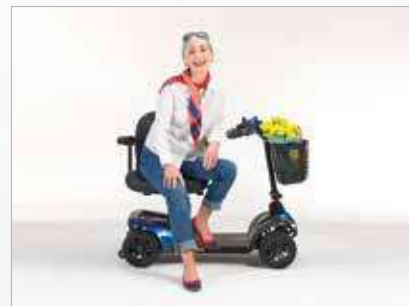
Asiento giratorio para transferencias más fáciles